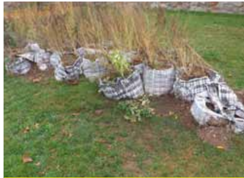
Der Wandergarten, hier mit meiner Hanfzucht.

würde ich meinen Mitmenschen etwas Lebenshilfe geben. Gerade denen, die des Öfteren ihren Wohnort wechseln müssen und trotzdem so etwas wie eine grüne Seele haben. Gern hätten diese vielleicht einen Garten zur Entspan-