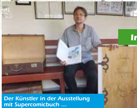
Der Künstler in der Ausstellung mit Supercomicbuch ...

... und bei der Arbeit am Gästebuch. ... tung Kurier und fertigte das Layout der Comicfachzeitschrift »Comic Forum«. 1989 unternahm er eine 2-fache Durchquerung der Sahara, bei der er in Algerien zufällig auf den späteren König von Saudi-Arabien Abdullah traf und mit ihm Tee trank. Anfang der 90er Jahre war er freiberuflich als Screendesigner für CD-Rom Produktionen und Computerspiele tätig. 1995 erschien sein erstes Bilderbuch im Annette Betz Verlag »Es war einmal ein Zauberer ganz allein« (das sich heute noch in Südkorea großer Beliebtheit erfreut). 1997 Geburt seiner Tochter und Auswanderung nach Irland, wo er viele weitere Bücher für deutsche, österreichische und irische Verlage zeichnete. Die Bücher wurden ins Finnische, Schwedische, Koreanische, Chinesische, Holländische, Amerikanische und Ungarische übersetzt. Ab 2006 arbeitet er auch als Kolorist für Werbeagenturen in Österreich, Deutschland und der Schweiz. Nach einer eher rastlosen Phase, die ihn durch die USA, Slowakei und Belgien trieb, ließ er sich 2013 in Kassel nieder. Seither entstanden 7 Bilderbücher für