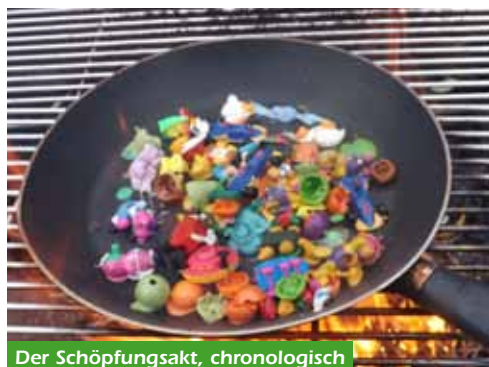
Der Schöpfungsakt, chronologisch

Bock'schen Fotos und dessen vagen Schilderungen folgender Ablauf dar, denn ich hier gern für die kunstinteressierte Leserschaft rekonstruiere. Eine Verschiebung der Performance zog Bock trotz fehlender Rückmeldungen zu keiner Zeit in Betracht. Warum auch, Glühwein und sonstiges waren nun einmal da und so startete er gegen 8 Uhr mit der rituellen Zerkleinerung und anschließender Schichtung des sehr