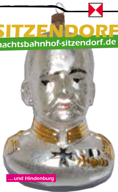
... und Hindenburg

Weihnachtsbaumschmuck. Aber ebensowurden hier Murmeln und Glasaugen hergestellt. Letztere könnten dem Besucher glatt aus dem Kopf fallen, wenn er den historischen Güterboden am Bahnhof Sitzendorf-Unterweißbach betritt. Hier an der idyllischen Schwarzatalbahn gibt es mit dem Weihnachtsbahnhof eine allererste Adresse für