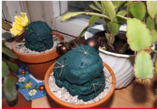
Mammillaria macroantha natalicum (links) Grusonii macroantha natalicum (Mitte) und gemeiner Weihnachtskaktus

kaktus. Meine Ausgangsmaterialien sind der Humboldt-Warzenkaktus und der Goldkugelkaktus. Bei beiden Arten betrieb ich eine gezielte Auswahl mit dem Augenmerk auf portraithafte Wucherungen des Wassergewebes und der Epidermis. Nach langwierigen Versuchsreihen gelang schließlich die Züchtung eines weihnachtsmannköpfigen Kaktus in sattem Schultafelgrün mit Akne-artigem Assimilationsgewebe. Wert legte ich auch auf die pfriemförmigen Dornen und durch die Einkreuzung auf eine Blüte der Gattung Wigginsia. Nun habe ich für Sukkulenten-Liebhaber noch eine freudige Nachricht. Im Frühjahr rechne ich mit weiteren verkaufsfähigen Exemplaren. Und da dann Weihnachten bereits Geschichte ist, werde ich sie wahrscheinlich unter dem Namen Nischel-Kaktus (nach dem berühmten Karl-Marx-Denkmal in Chemnitz) auf den Markt werfen.