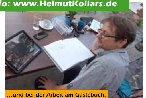
...und bei der Arbeit am Gästebuch.