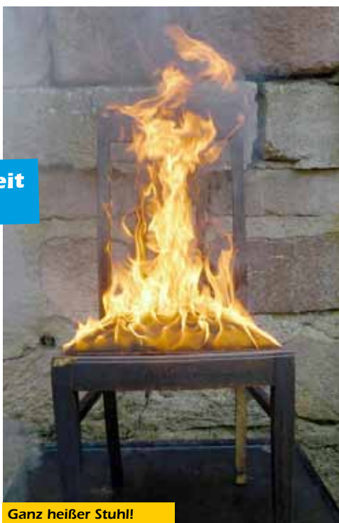
Ganz heißer Stuhl!

»In wahrscheinlich den meisten Haushalten werden zum Fest Weihnachtsbäume aufgestellt und festlich geschmückt, vielleicht noch mit Lametta behangen und mit Glitzereffekten besprüht. Im neuen Jahr haben sie dann ihren Dienst verrichtet und werden entsorgt. Im günstigsten Fall in