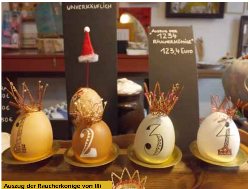
Auszug der Räucherkönige von Illi