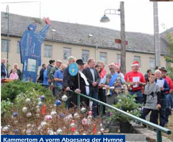
Kammertom A vorm Abgesang der Hymne

Schwesterstadt Lunzenau, ein letztes Mal. Es war der 11. Markt, und dies, obwohl er schon anfangs von Skeptikern für tot erklärt wurde und sogar die Verhaftung des Veranstalters wegen Blasphemie aus einem südlichen Freistaat gefordert wurde. Dabei berichtete gleich zu Beginn und in Folge der Rundfunk (auch aus Österreich!), Fernsehen und die Presse deutschlandweit vom verrückten Markttreiben. Immer stand dieses unter einem Thema. So gab es einen spektakulären Bergmann-Umzug, der Schneemann ließ es schneien, Weihnachtsbäume tanzten, der Nikolaus kam mit Boot und hochrangige Politiker in Weihnachtsmannverkleidung, es gab eine Weihnachtsolympiade und einen Malwettbewerb und 2015 spielte die Fluchtgeschichte eine zentrale Rolle und die Eröffnungsrede hielt der Bürgermeister auf einem echten Dromedar sitzend. Dieses Jahr war es der Auszug der 1234 Weihnachtsmänner (sehr großzügig gezählt), und diese nahmen auch gleich den Weihnachtsbaum mit. Immerhin