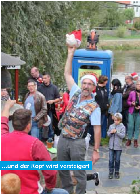
...und der Kopf wird versteigert