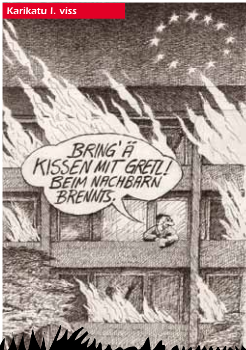
Karikatu I. viss