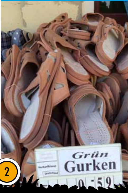
Schöner Zuchterfolg eines Hobbygärtners: Grüne Gurken