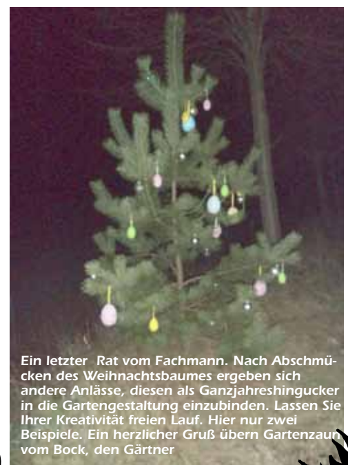
Ein letzter Rat vom Fachmann. Nach Abschmücken des Weihnachtsbaumes ergeben sich andere Anlässe, diesen als Ganzjahreshingucker in die Gartengestaltung einzubinden. Lassen Sie Ihrer Kreativität freien Lauf. Hier nur zwei Beispiele. Ein herzlicher Gruß überm Gartenzaun vom Bock, den Gärtner