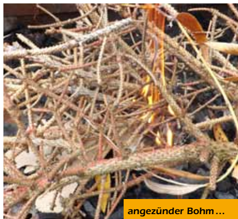
angezündeter Bohm ...