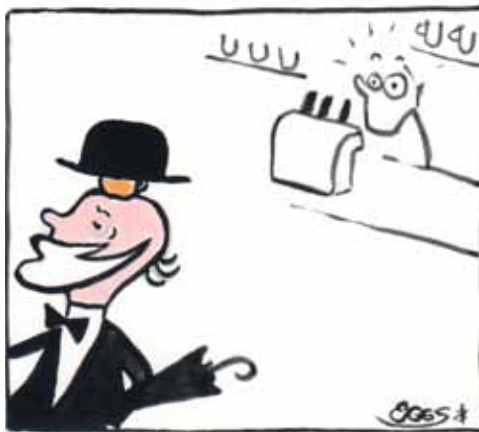
Professor sein Bier

nach dem Besuch der Oberschule und dem Dienst in der NVA als Kampfschwimmer, in Leipzig Kunstgeschichte und Kulturwissenschaft. blieb aber über den gesamten Zeitraum dem Brauwesen als Endverbraucher treu. 1999 schloss er das Studium als Magister ab und begab sich auch künstlerisch auf Wanderschaft. Nachhaltig bleibt sein Einfluss in der Sparte »Bauwerke Sand« mit Objekten an der spanischen Küste und seine stilprägenden