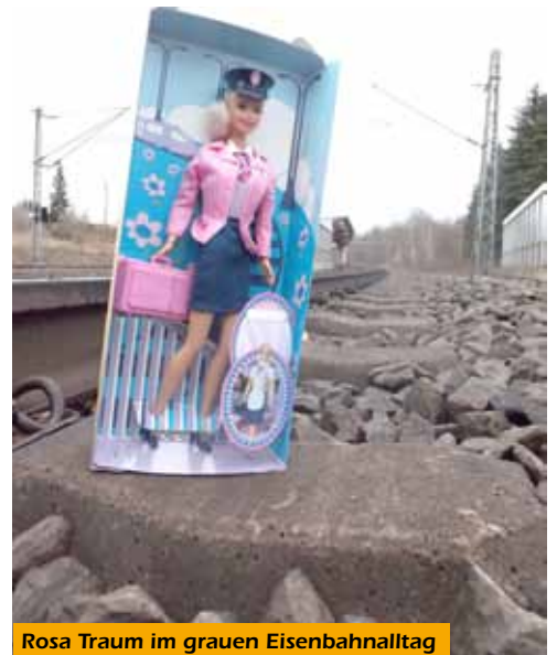
Rosa Traum im grauen Eisenbahntag

als Zugbegleiterin! Sehr rosa, sogar das Köfferchen, blaues Röckchen, ebenso das Mützchen. Dieses trug ein Emblem einer mir nicht bekannten Eisenbahnverwaltung. Rosa „B“ im rosa Oval. Im Köfferchen hatte sie noch ein zartrosa Schürzchen für ihre Tätigkeit als Zugserviererin. Serviert wurde dann alles auf rosa Tellerchen und Tässchen, das Steak schön rosa. Selbst die Tickets: rosa. Leider, um auf