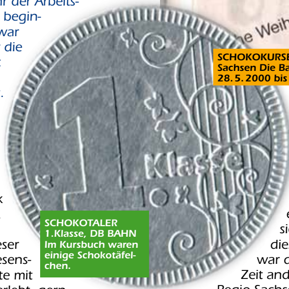
SCHOKOTALER 1. Klasse, DB BAHN Im Kursbuch waren einige Schokotäfelchen.

materialien für den Berufsnachwuchs. Mangels Alternative war der Reisende eh auf die Reichsbahn angewiesen, ergo brauchte man sich auch nicht um diese bemühen. Das war dann zu der neuen Zeit anders, und auch DB