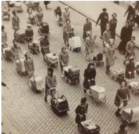
Fahrt mit seiner Oma zur bayrischen Massentau- fe, Achte von links oben zur Mitte.