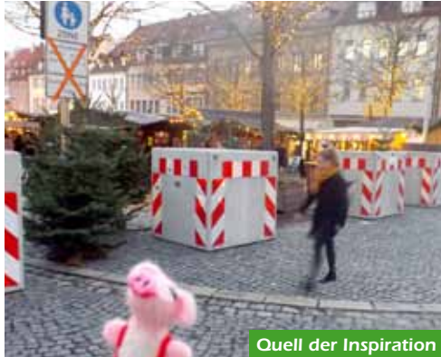
Quell der Inspiration